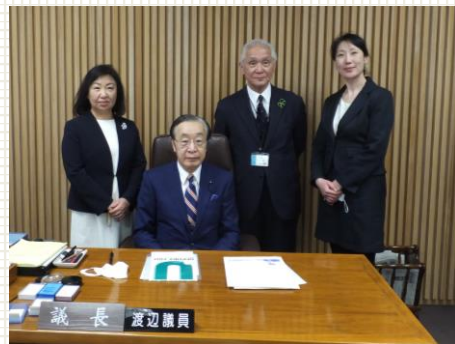
後援会事務局も議長室へ行ってきました。