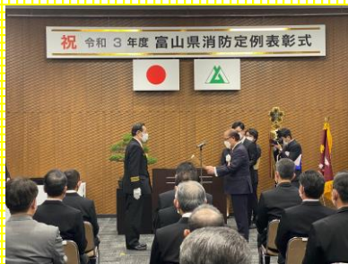
3月12日 富山県消防定例表彰式