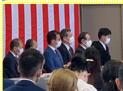
4月4日 定塚小と平米小が合併してできた高陵小学校の入学式に参加