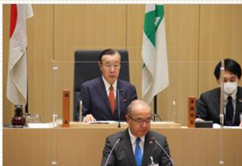
3月24日 第130代 富山県議会議長に就任いたしました。