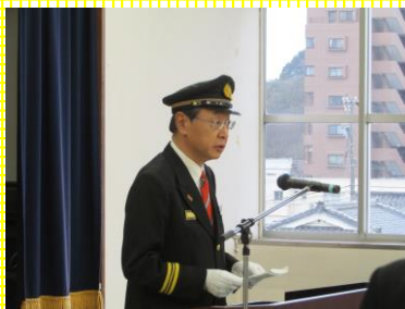
4月1日 消防団長として辞令交付式