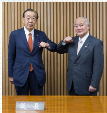
五十嵐前議長と肘タッチ